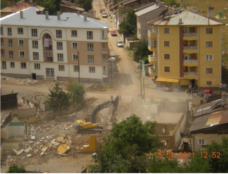
Resim 1. Sivas'ta tek katlı konulardan çok katlı binalara geçiş