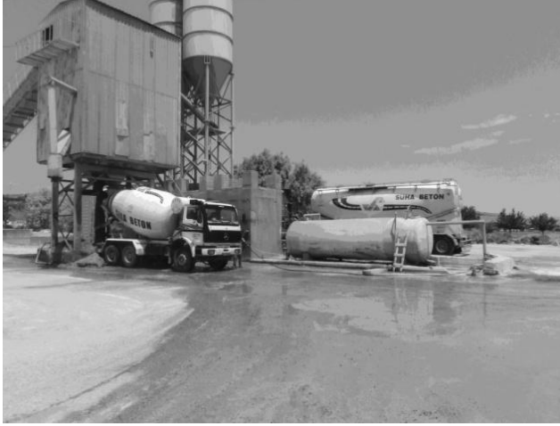
Şekil 2. Süha Hazır Beton Tesisi

Firmanın Çevre Etki Değerlendirilmesi ve Yönetim Prosedürü; firma faaliyetlerinin, ürünlerinin ve hizmetlerinin fiili ve potansiyel çevresel boyutlarının gözden geçirilmesi, etkilerinin belirlenmesi ve önemlilerinin seçilmesi için izlenecek yöntemi açıklamaktadır. Çevre boyutları gözden geçirilirken aşağıda açıklanan konular göz önünde bulundurulmaktadır;