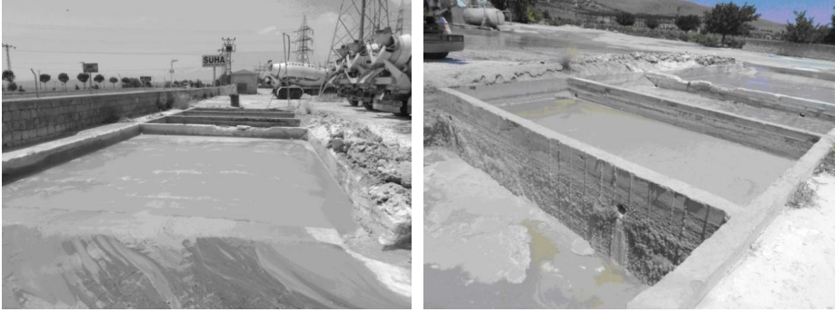
Şekil 3 ve Şekil 4. Süha Hazır Beton Tesisinde Yer Alan Geri Dönüşüm Havuzu

Havuzlarda biriken katı atıklar ile diğer hafriyat toprağı atıkları ise, toplanarak tesis bahçesinde yer alan boş alana dökülmektedir. Şekil 5’de, atıkların biriktirildiğı bölge görülmektedir.