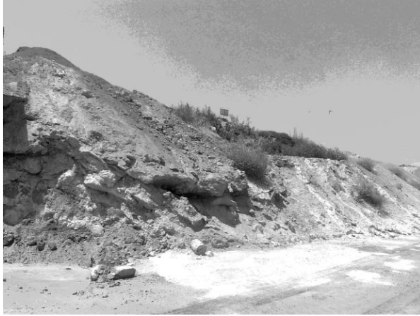
Şekil 5. Süha Hazır Beton Tesisinde Biriktirilen Katı Atıklar.

Havuzlarda biriken katı atıklar ile diğer hafriyat toprağı atıkları ise, toplanarak tesis bahçesinde yer alan boş alana dökülmektedir. Şekil 5’de, atıkların biriktirildiğı bölge görülmektedir.